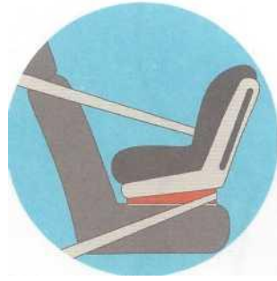
Лицом против движения