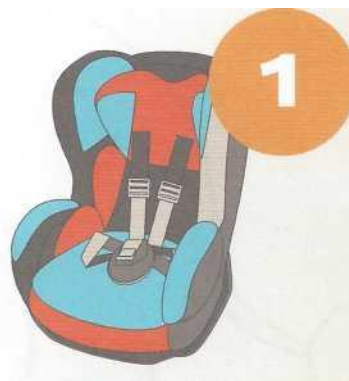
9-18 кг от 9 месяцев до 4 лет