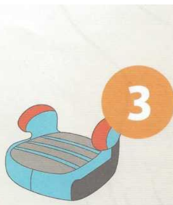
22-36 кг от 6 до 12 лет