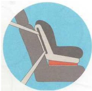
Лицом по ходу движения

Самое безопасное место для установки детского кресла в автомобиле — среднее место на заднем сиденье. Самое небезопасное - переднее пассажирское сиденье. Туда автокресло ставится в крайнем случае, при обязательно отключенной подушке безопасности.