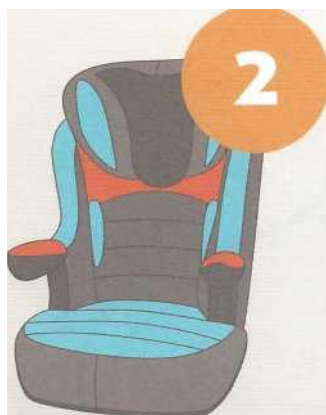
15-25 кг от 3 до 7 лет