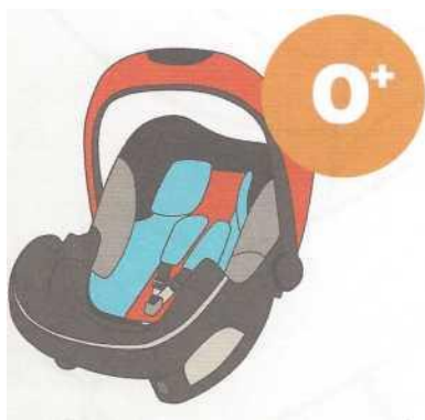
0-13 кг от рождения до 1 года

Покупайте кресло вместе с ребенком. Пусть он попробует посидеть в нем - прямо в магазине.